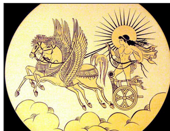
Figura 3 Reprezentări grafice ale lui Apollo