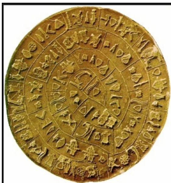
Figura 1 Discul lui Phaistos

mai complicată atunci când s-a descoperit că semnele scrise pe un pergament foarte vechi găsit într-un grup tuareg erau o formă ceva mai elaborată a alfabetului inscripționat pe discul lui Phaistos (Fig. 1). Discul a fost descoperit în anul 1908 și se crede că se află în depozitul din marele palat Minonian de la Sf. Treime din Creta.